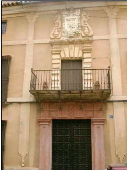
CASA SOLARIEGA C/ CARLOS GARZARÁN N° 11