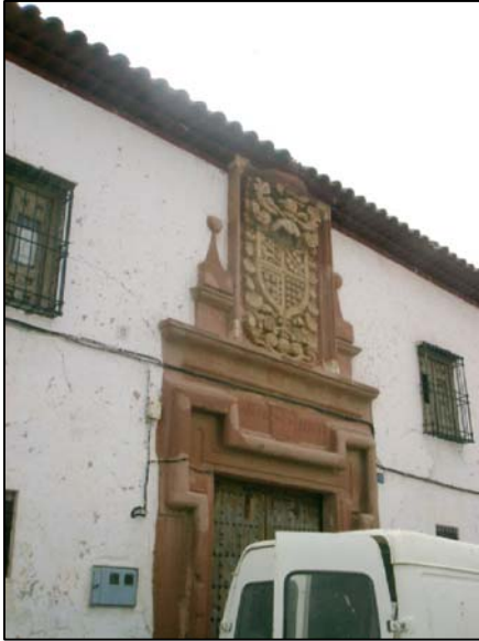
CASA SOLARIEGA DE LA PACA