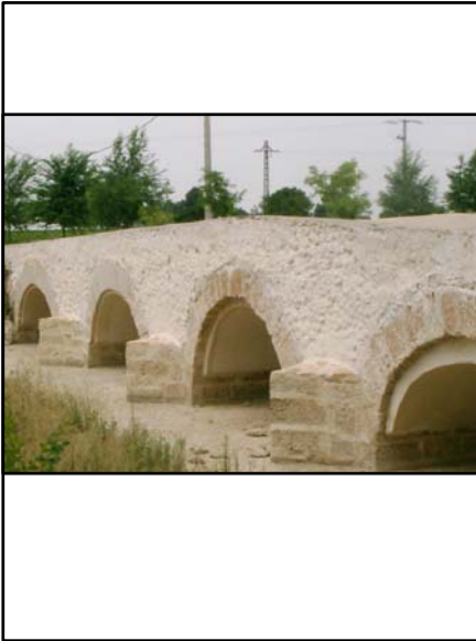
PUENTE DE SAN MIGUEL