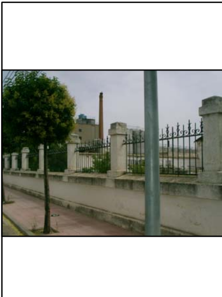
ALCOHOLERA BODEGA DEL MILLÓN