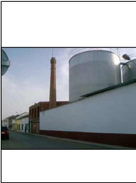
ALCOHOLERA BODEGA LA ACOGIDA