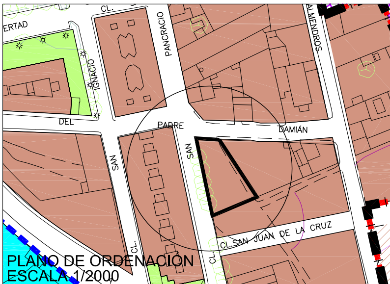
PLANO DE ORDENACIÓN ESCALA 1/2000