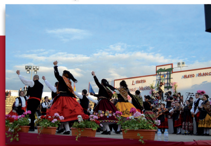
Fiesta del Mayo Manchego