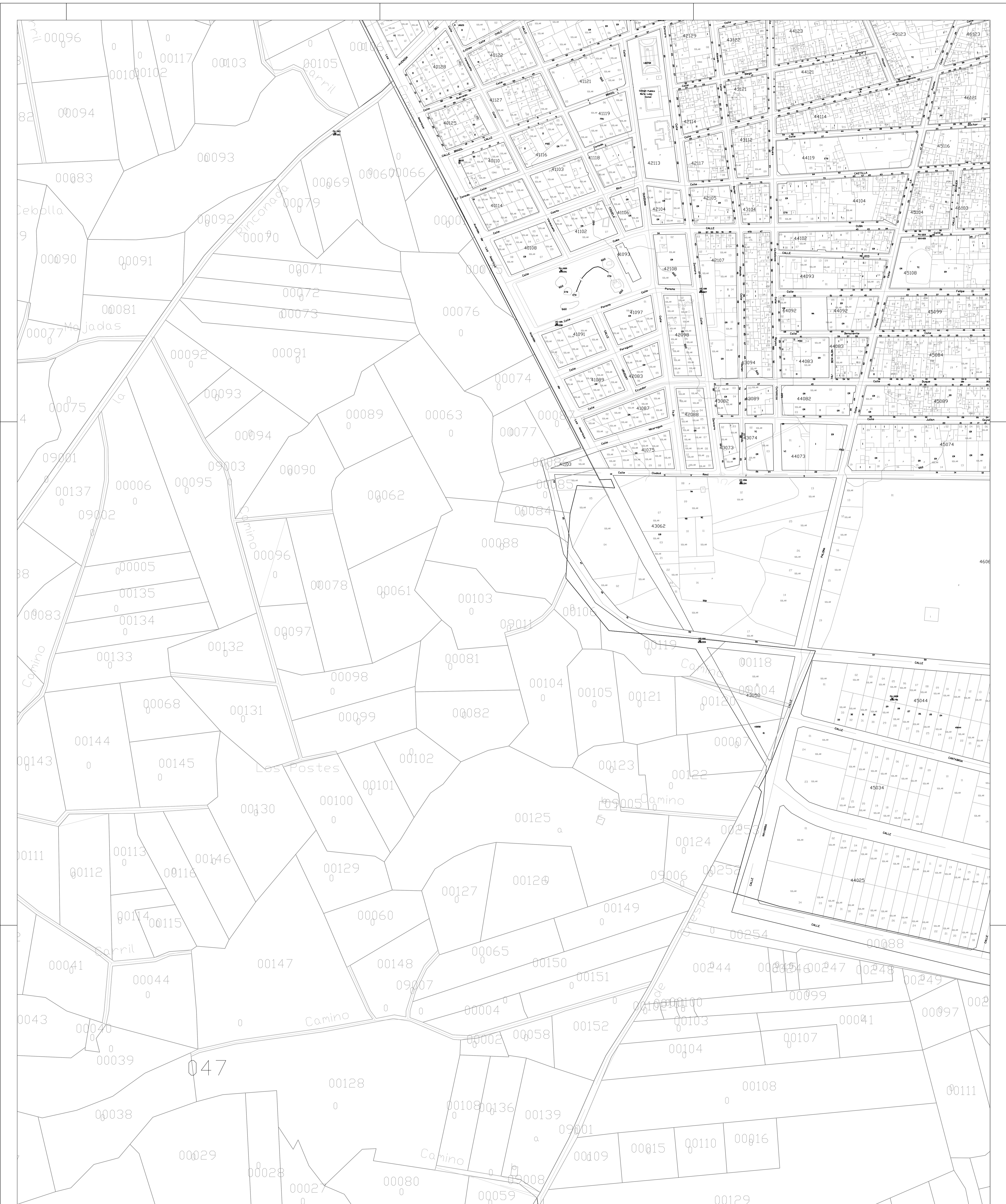
PLANO GUÍA URBANO