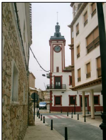
TORRE DEL AYUNTAMIENTO