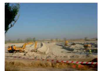
Recuperación lagunas Naturales - El Pedernoso (Cuenca)

Tlf. CENTRALITA 967 181 134 ( 8 extensiones ) OTRAS LÍNEAS 967 181 072 - 967 181 170 FAX: 967 180 116