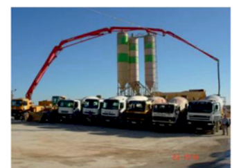
Planta de Hormigón - Mota del Cuervo (Cuenca)

Movimientos de Tierras - Pavimentaciones Urbanizaciones - Caminos Agrarios - Arídos Polg. Industriales - Arenas - Transportes especiales Redes de Saneamiento y Abastecimiento Plantas de Hormigón y Aglomerados, en Frío y Caliente