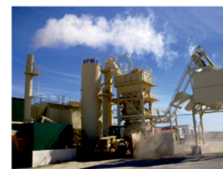
Planta de Aglomerado - Villanueva de Alcardete