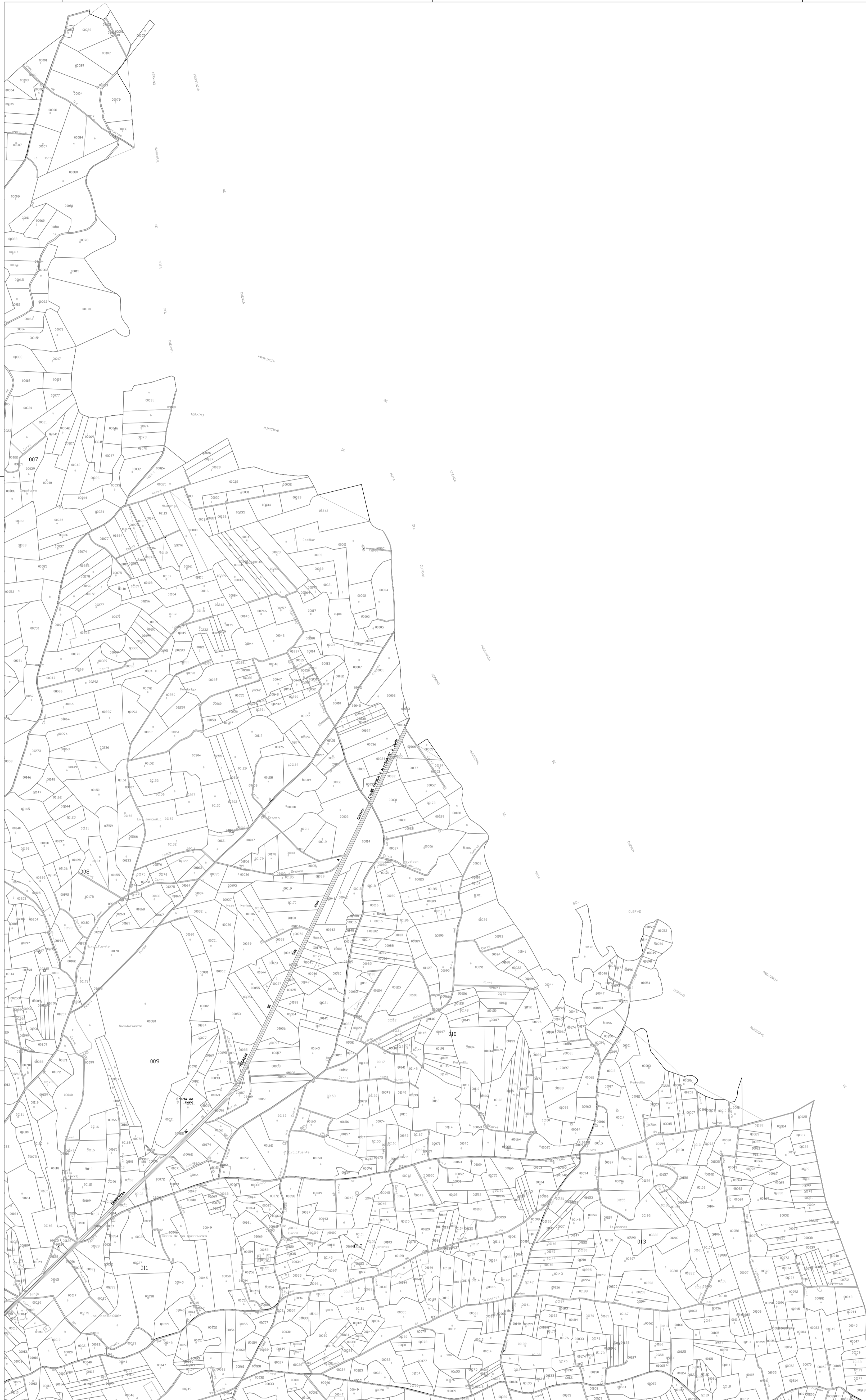
PLANO GUÍA RÚSTICO